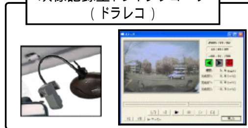
映像記録型ドライブレコーダ (ドラレコ)