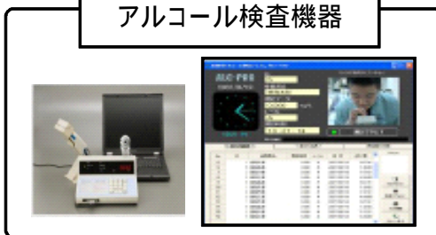
アルコール検査機器