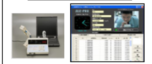
アルコール検知器