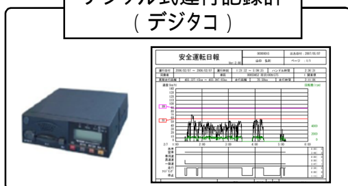
デジタル式運行記録計 (デジタコ)