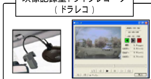
映像記録型ドライブレコーダ (ドラレコ)