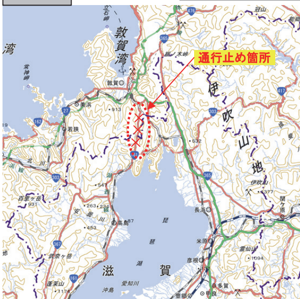
規制区間及び迂回路案内図