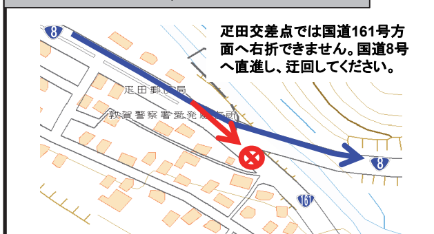
通行止め箇所詳細(福井県側 疋田交差点)