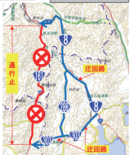
規制区間及び迂回路